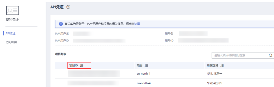
图 7-1 查看项目 ID